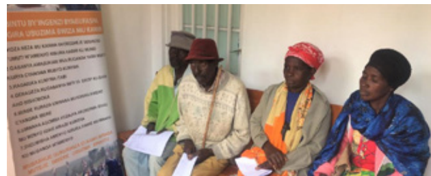
Patiënten wachten na de verdoving op de verlossende behandeling.

De situatie in het afgelegen en arme Gicumbi district is heel anders dan in de hoofdstad van Rwanda. Sinds 2014, heeft fADA in dit district 6 tandheelkunde klinieken opgezet. In het districtsziekenhuis te Byumba, en in 5 gezondheidscentra in de periferie. Deze klinieken worden uitsluitend bezocht door mensen met pijnklachten. Dus er zijn alleen maar spoedgevallen. In de 6 fADA klinieken in het district is de verlening van tandheelkundige eerste hulp gewoon door gegaan, ondanks het ontbreken van de benodigde beschermingsmaatregelen. In Health Center Manyagiro komen elke dag zo veel mensen met kiespijn, dat er volgnummers worden uitgereikt. Dat bracht ongerustheid en stress met zich mee voor de tandartsen.