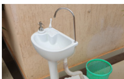
Handenwasinstallatie buiten voor de arriverende patiënten van de fADA kliniek in Kigali

Inmiddels was in Europa al bekend hoe tandartsen zichzelf en hun patiënten konden beschermen tegen besmetting met het Corona virus. Deze informatie werd door fADA naar Kigali verstuurd en zo kon samen met de gezichtsmaskers het werk in de fADA kliniek weer van start.