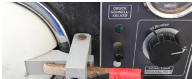
Als de apparatuur zo intensief gebruikt moet worden, treden gebreken op. Afrikaanse reparatie van de sluiting van de autoclaaf.