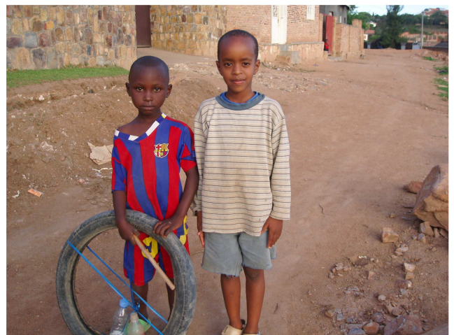
Speelgoed in Rwanda

Wat me zo aanspreekt in fADA zijn het kleinschalige, het praktische en de hele korte lijnen binnen de organisatie. Wat begon als hulpverleners gaat meer en meer richting samenwerken, en dat bevalt me. Het sluit mooi aan bij mijn eigen ervaring, namelijk dat veel mensen in Afrika een hekel hebben aan het hulpverleningssyndroom. De scherpste kritiek op ontwikkelingshulp komt tegenwoordig van Afrikanen zelf. Ze zijn niet zielig, dus bewegen we ons van een 'one way supply of goodness' naar een 'two way process'. Ook als het om tandheelkunde gaat valt er wederzijds van elkaar te leren: als wij van onze kant kennis en vaardigheid inbrengen, leren we tegelijkertijd over tandheelkundige problemen die hier onbekend zijn.